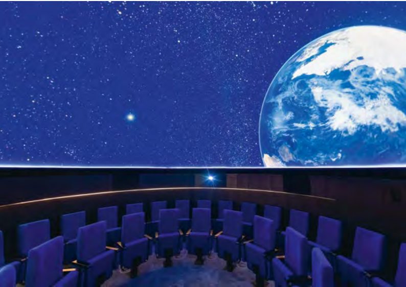
Planetarium im Vonderau Museum