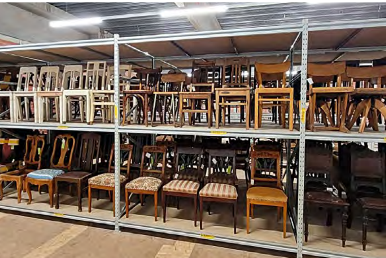
Blick in das Stuhllager im Außendepot