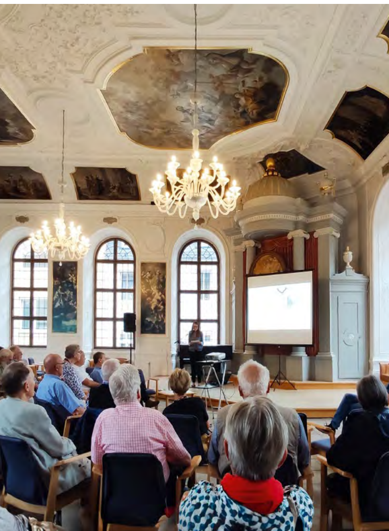
Museumsgespräch in der Kapelle

Alle aktuellen Informationen zum Programm erhalten Sie unter www.museum-fulda.de .