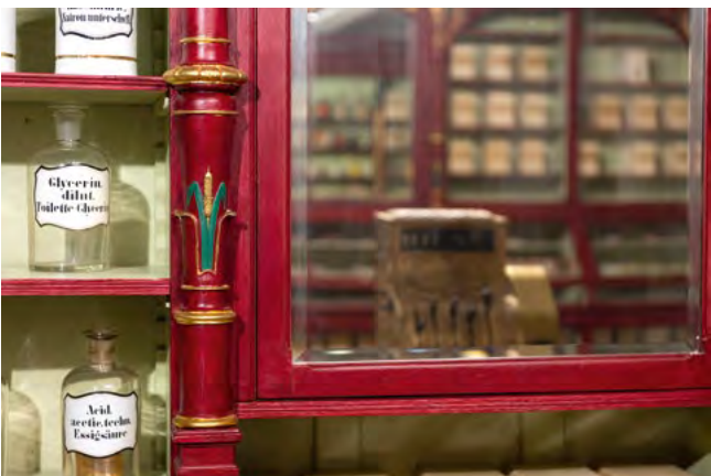
Detailaufnahme Drogerie Zum Krokodil

Im Schaufenster des Museumseingangs präsentiert das Vonderau Museum das „Objekt des Monats“. Mit dieser Reihe geben wir Ihnen einen Einblick in die gesamte Bandbreite der Sammlungen zu Kultur, Natur und Kunst. Die monatlich wechselnden Objekte werden mit kurzen Texten der Museumsmitarbeiterinnen aus den einzelnen Abteilungen vorgestellt.