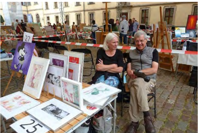
Malfestival im Museumshof

Ein Vortragsabend mit Weinverkostung Kartenvorbestellung über Tel. 0661/102-3210 oder info@freundedesmuseums.de