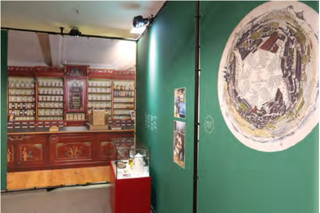
Ausstellung der Fuldaer Museen, Vonderau Museum