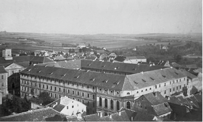
Vonderau Museum vom Turm der Stadtpfarrkirche, um 1865