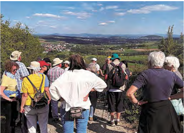
Botanische Exkursion