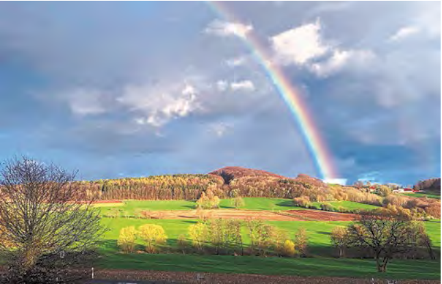
Giebelrain bei Dietershausen