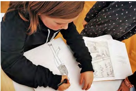
Kunstkurs in der VILLA Franz Erhard Walther

Mehr Informationen zu den Ausstellungen und Veranstaltungen finden Sie auf www.villa-few.com .