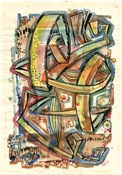
Karlfried Staubach „Komposition (Achterbahn)“, Wasserfarbe und Tusche, 1956

Mit „Karlfried Staubach – Retrospektive“ knüpft das Vonderau Museum an seine Ausstellungsreihe von Künstlerinnen und Künstlern des Jungen Kunstkreises an. Der Pädagoge, Grafiker und Künstler Karlfried Staubach hat mit seiner Kunst neue Wege aufgezeigt, jenseits des konservativen akademischen Malstils. Wie kein anderer prägte er die Kunstszene der 50er und Anfang 60er Jahre in Fulda. Staubach war Gründer des Jungen Kunstkreises Fulda sowie der Galerie Junge Kunst und verstand es, junge Leute zu begeistern und mitzureißen. In einer Retrospektive wird seine künstlerische Vielfalt gezeigt, von den Anfängen Mitte der 40er Jahre bis zu seinem frühen Tod 1964. In Kooperation mit dem Förderkreis Galerie 21 e.V.