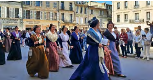
La fête des Gardians

In Kooperation mit dem Freundeskreis Fulda-Arles e.V.