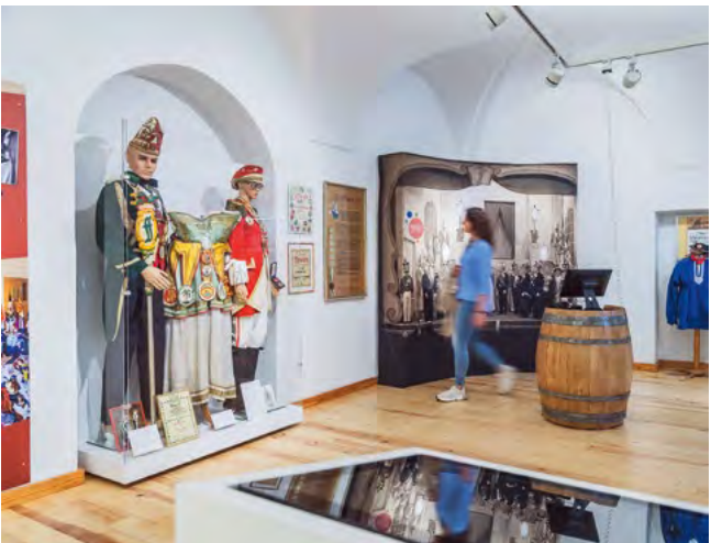
Blick in das Fastnachtsmuseum

Im Fastnachtsmuseum wird die Fuldaer Foaset lebendig. Infotafeln und zahlreiche Ausstellungsstücke beleuchten ihre Geschichte von den Anfängen bis zur Gegenwart. So zeigt das Museum unter anderem Bilder, Kostüme und natürlich die Fuldaer „Schwellköpfe“. Auf drei Medienstationen werden Büttenreden und viel Wissenswertes zum Straßen- und Saalkarneval sowie zur Fuldaer Karnevalsgesellschaft und den Randstaaten vermittelt. Dabei richtet sich das Museum nicht nur an Karnevalisten, vielmehr kann man die Zeit- und Stadtgeschichte aus einem anderen Blickwinkel, nämlich anhand des Karnevals entdecken.