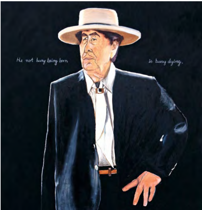
Robert Allen Zimmerman (He not busy being born is busy dying)