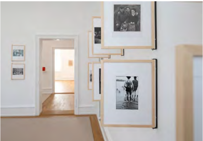
Ausstellungsansicht BILDBAUSTOFF. Prägungen 1957-1960 in der VILLA, Fulda, 2024.

Franz Erhard Walthers Werkentwurf gehört zu den wichtigsten künstlerischen Positionen unserer Zeit. Die radikale Einbeziehung der Betrachterinnen und Betrachter als aktiven Teil der Werkentstehung hat Generationen von Kunstschaffenden geprägt. Mit der VILLA wurde ein Ausstellungsort geschaffen, der den Besucherinnen und Besuchern die Möglichkeit gibt, Kunst von Weltrang zu entdecken und kennenzulernen. In den mit großer Expertise kuratierten Ausstellungen wird das Werk Walthers im Dialog mit internationalen Positionen präsentiert und in konzentrierten Projekten zentrale Fragestellungen des Werkes thematisiert. Die aufwendig renovierten Räume der in Domnähe gelegenen VILLA und der neu konzipierte Hof bilden den Rahmen für zahlreiche Veranstaltungen.