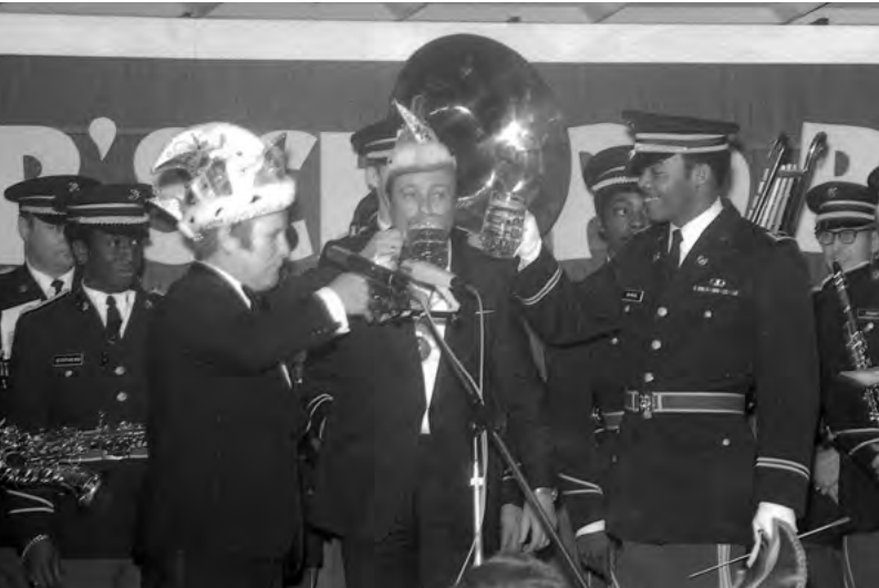
Besuch der US-Army-Band beim RaRaRi