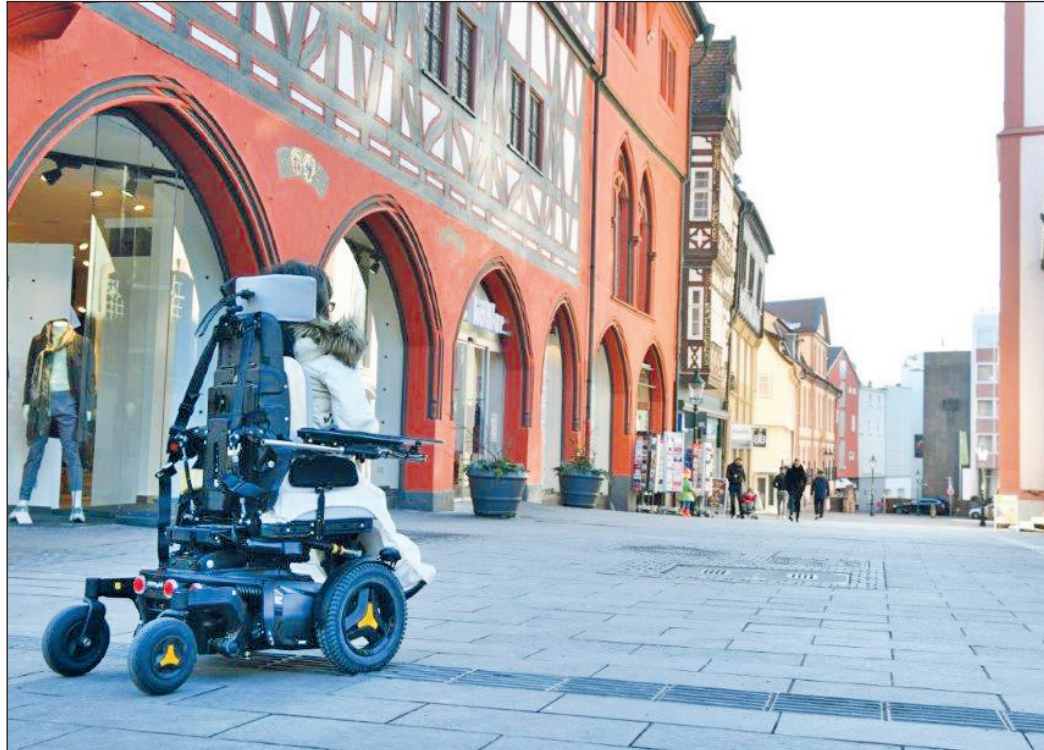
Rollstuhltaugliche Wege und tastbare Leitsysteme für Blinde – das sind zwei der vielen Felder, auf denen der Beirat der Menschen mit Behinderungen aktiv mitgestaltet.

In den vergangenen zwölf Jahren konnte der BMB viele Projekte und Vorhaben anstoßen, begleiten und erfolgreich