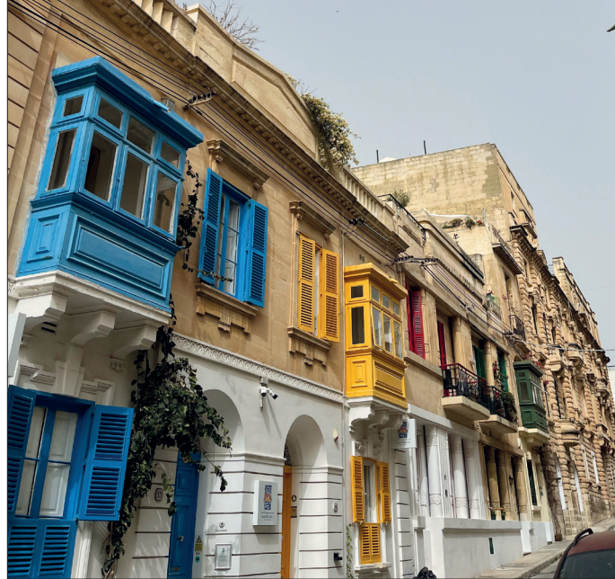
Malerische Gassen in der Altstadt von Valletta und eine faszinierende Küste – die Insel Malta hat viel zu bieten und ist auch für ein Auslandspraktikum in der öffentlichen Verwaltung bestens geeignet.

Wunderlich konnte in den ersten Wochen seines Praktikums zum Beispiel Einblick in die Auswertung von Aufnahmen einer Überwachungskamera nehmen – hier wurde eine verkehrskritische Kreuzung permanent unter die Lupe genommen und die Verkehrsströme und -probleme durch die Videoauswertung analysiert. Auch in Fragen der Müllentsorgung war er eingebunden. In den letzten Wochen seines Praktikums kontrollierte er dann die Zahlungseingänge und offenen Forderungen bei Verwarngeldern. Hierbei hat er beobachtet: „Der Bußgeldkatalog hat insgesamt viele Parallelen zu dem deutschen. Jedoch ist die Auslegung bei falschem Parken deutlich strenger. Beispielsweise wird unzulässiges Halten im absoluten Halteverbot mit einem Bußgeld von 80