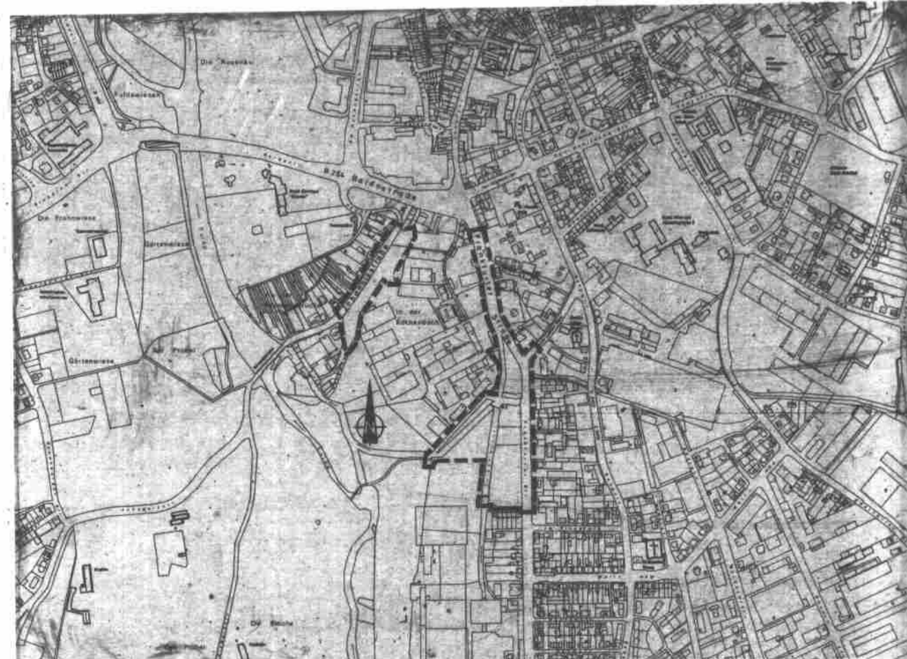
Übersichtsplan M:1:10000 ----- Grenze des Geltungsbereiches

Fulda, den 17.8.1992 Der Magistrat der Stadt Fulda ( SIEGEL ) GEZ. DR. HAMBERGER Oberbürgermeister