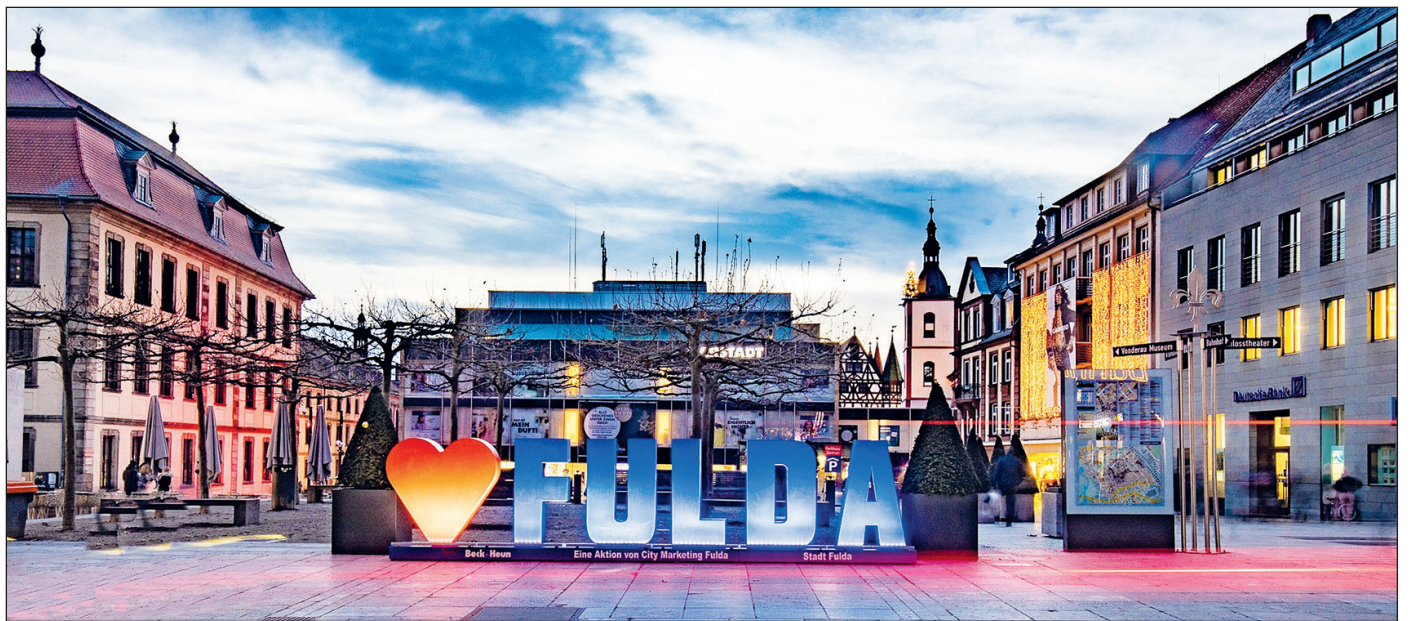
Die Innenstadt Fuldas hat viele Stärken – doch es gibt immer Verbesserungs- und Anpassungsbedarf.