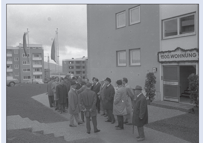
Im Mittelpunkt des Vortrags am 13. März steht die Geschichte des Fuldaer Aschenbergers – mit zahlreichen historischen Fotos wie diesem aus dem Jahr 1968.

Instagram für Einsteiger/-innen Sie möchten Instagram, den kostenlosen Online-Dienst zum Teilen von Fotos und Videos kennenlernen? Sie erhalten hilfreiche Tipps, wie Sie mit der Plattform arbeiten. Termin: Samstag, 23. März, 9 bis 13.30 Uhr Ort: Kanzlerpalais, Raum 209/EDV Gebühr: 25,20 Euro, 1 Termin